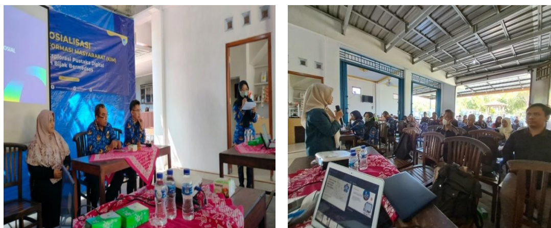
Gambar 3. Dokumentasi kegiatan pelatihan eksplorasi pustaka digital dan bijak bersosial media

Kegiatan pengabdian masyarakat ini telah dilaksanakan secara tatap muka pada tanggal 17 Mei 2023 pukul 12.30-16.30 WIB di Rumah Makan Kopi Bagongan, Nomporejo, Kapanewon Galur, Kabupaten Kulon Progo. Kegiatan ini merupakan kerja sama antara Dosen Fakultas Teknologi Informasi dan Bisnis (FTIB) IST AKPRIND dengan KIM Kulon Progo. Tema pelatihan yang dipilih merupakan permintaan dari masyarakat yang disampaikan melalui surat ke LPPM IST AKPRIND. Materi disusun sesuai kebutuhan peserta dan disampaikan dengan metode ceramah dan praktik. Selain itu pelaksanaan kegiatan juga menggunakan metode diskusi dan tanya jawab. Kegiatan pelatihan diikuti oleh 60 peserta dari KIM dan Dinas Kominfo Kulon Progo. Dalam pelaksanaan acara terjadi banyak diskusi dan tanya jawab antara peserta dan narasumber. Diskusi tidak ada seputar pustaka digital dan sosial media, tetapi juga seputar serba serbi teknologi informasi saat ini. Hasil pelatihan dapat menambah wawasan masyarakat, sehingga dapat meningkatkan kemampuan dalam mencari informasi digital dan menggunakan sosial media dengan bijaksana. Dokumentasi kegiatan pelatihan eksplorasi pustaka digital dan bijak bersosial media dapat dilihat pada Gambar 3.