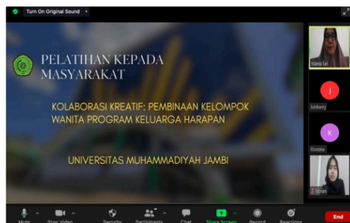
Gambar 1. Dokumentasi Kegiatan

Pelaksanaan kegiatan “Kolaborasi Kreatif: Pembinaan Kelompok Wanita Program Keluarga Harapan” pada tanggal 02 Desember 2024 berhasil dilaksanakan melalui aplikasi Zoom dengan 30 partisipan berhasil dilaksanakan dengan baik. Adapun dokumentasi dari kegiatan ini yaitu sebagai berikut: